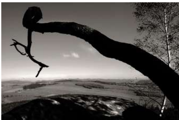
Eva Stanovská - Nad krajinou Broumovských skal