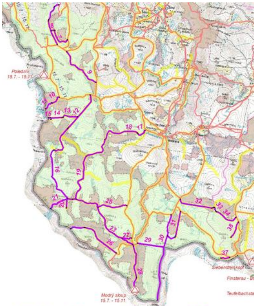
Návrh nových cest mezi Poledníkem a Bučinou.

Někteří turisté zajásají, většina milovníků přírody se zděsí. Nová turistická mapa NPŠ, jak ji v březnu představil ředitel Stráský, totiž obsahuje 94 nových úseků stezek. Turistický funkcionář tak zřejmě prověřoval, zda už týdny psychicky masírování odborníci parku dostatečně vyměkli a jeho neuvěřitelnou vizi schválí.