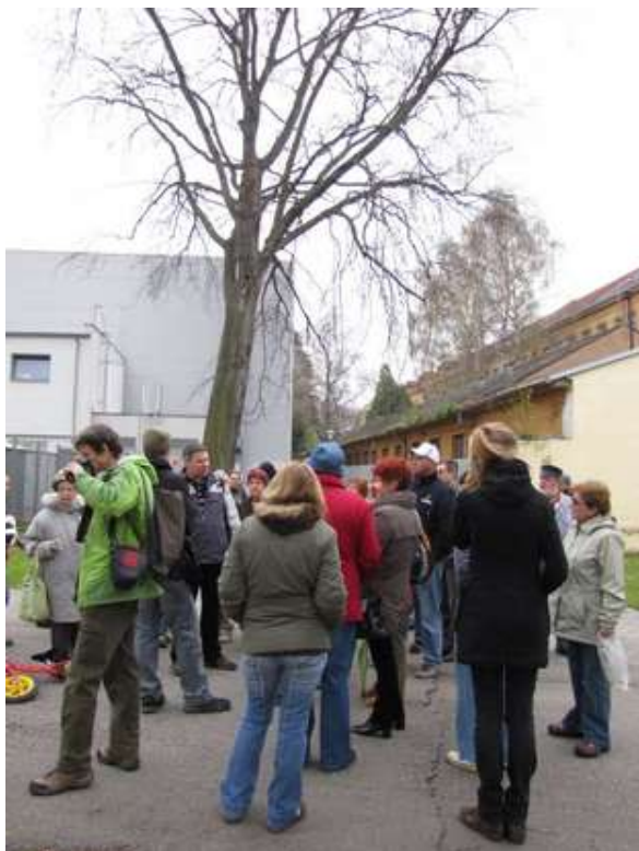
Za stromy a historií do centra II, 14. dubna