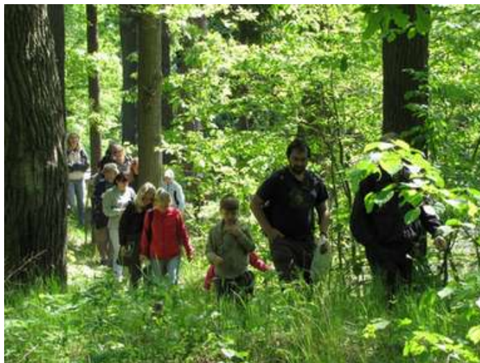
Za rostlinami a hmyzem do okolí Máje, 19. května