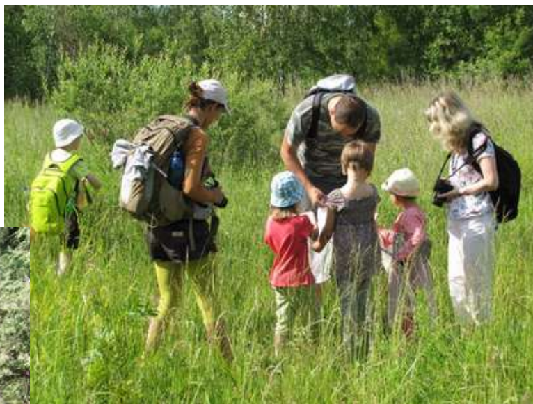
Motýli na tankodromu, 16. června