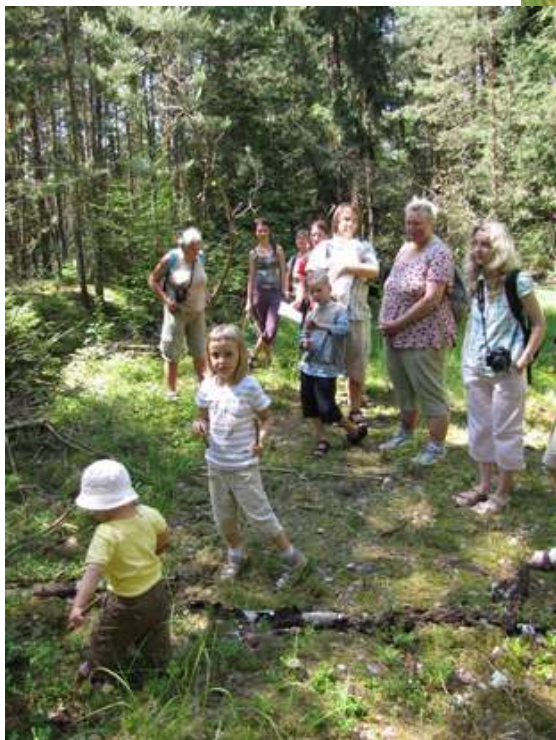
Příroda vrábečských pískoven, 23. června