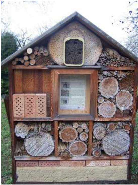
Hmyzí hotel v Linci