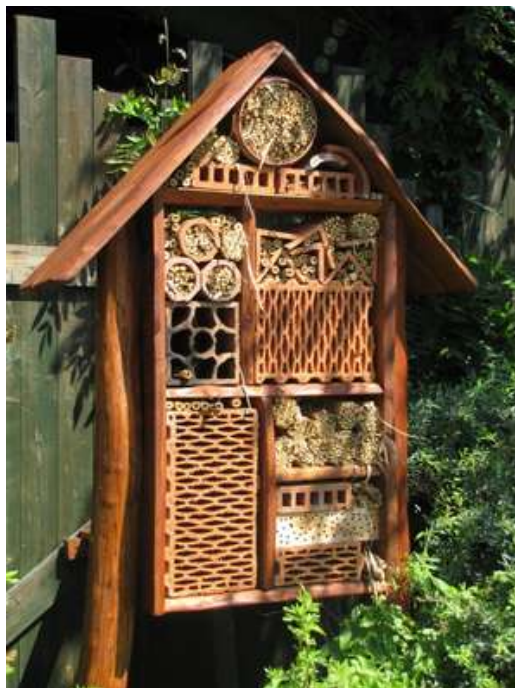
Hmyzí hotel v ZOO Ohrada