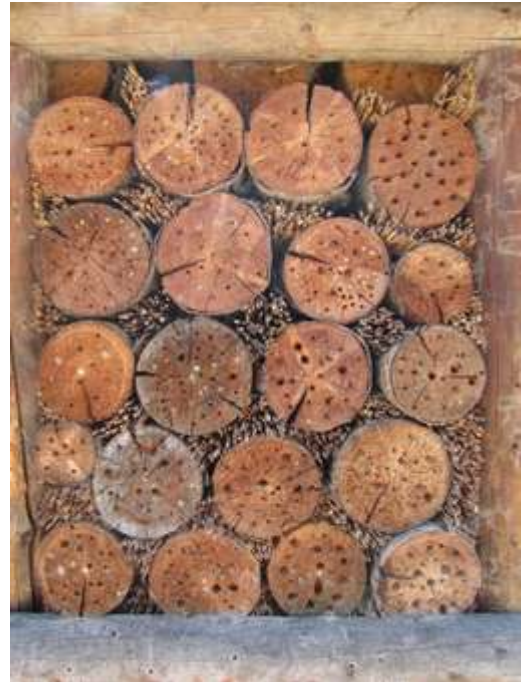
Hmyzí hotel v ZOO Praha