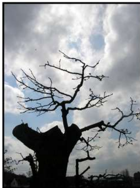
Vladana Švehlová – Zajímavé torzo stromu na hrázi rybníka Svět