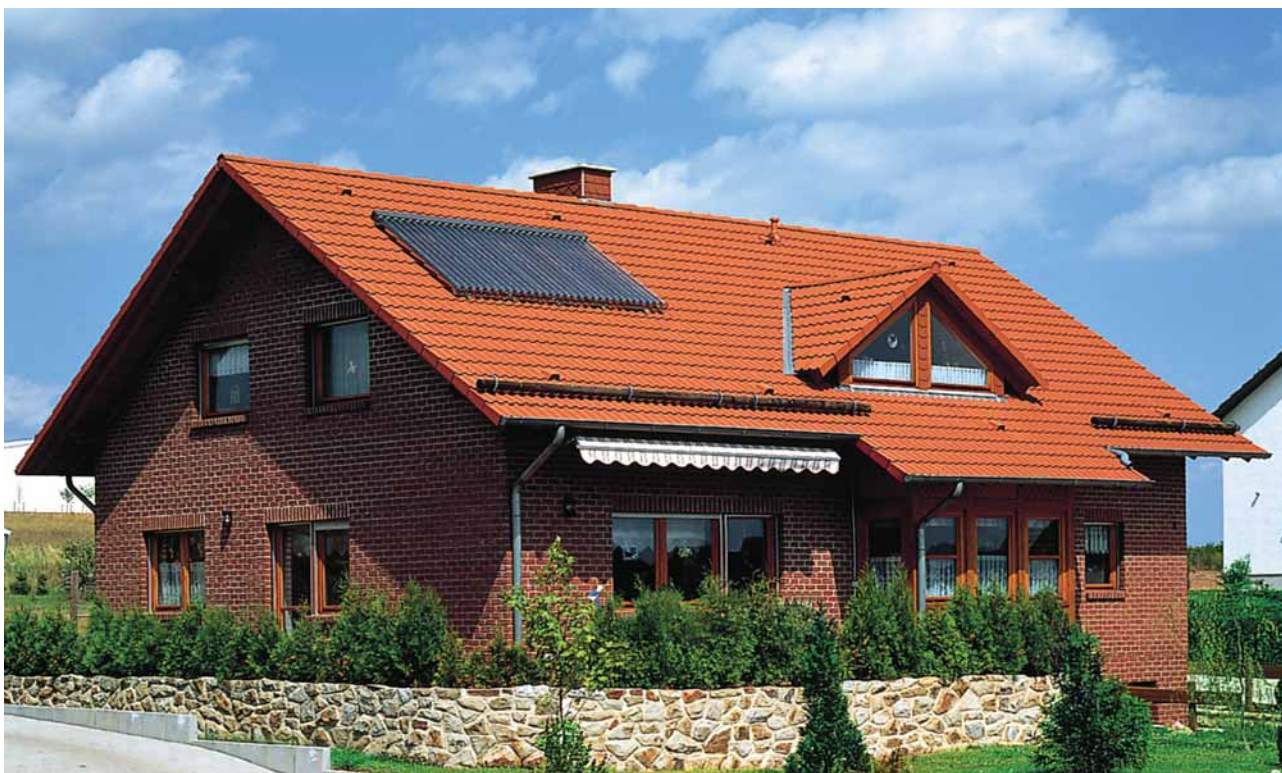
Solární kolektory ohřívají užitkovou vodu v rodinných domech

na účty velkých energetických a důlních společností.