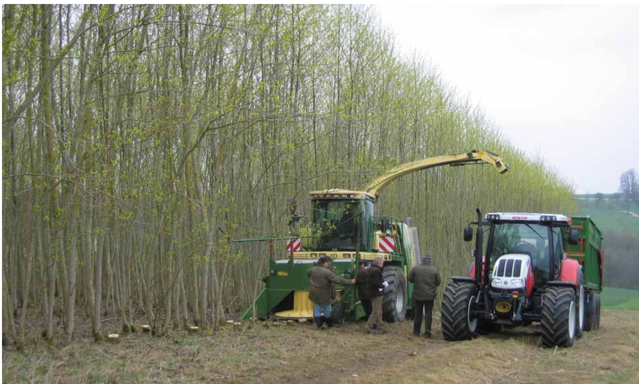
Pěstování energetických plodin obohatí krajinu, omezí odplavování půdy a zlepší zadržování vody, navíc vytvoří nová pracovní místa