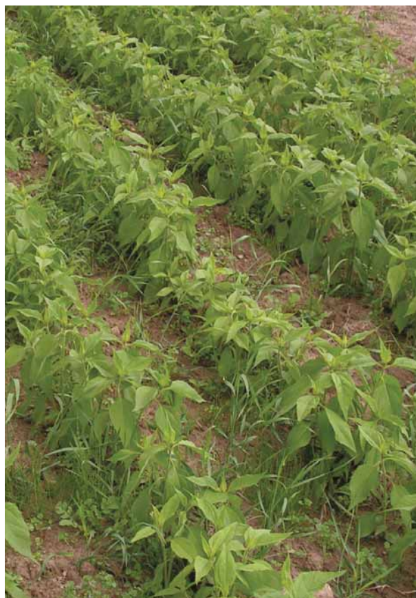
Energetické plodiny pěstované na zemědělské půdě, na obrázku topinambur – slunečnice hlíznatá

Decentralizace energetiky pomůže ekonomickému rozvoji venkova ještě jedním způsobem. Peníze za teplo – ročně se jedná o miliardy – zůstanou na místě a nezmqí