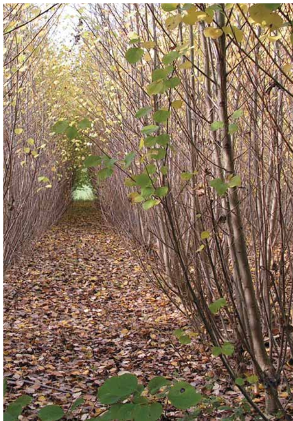
Plantáž rychle rostoucích dřevin