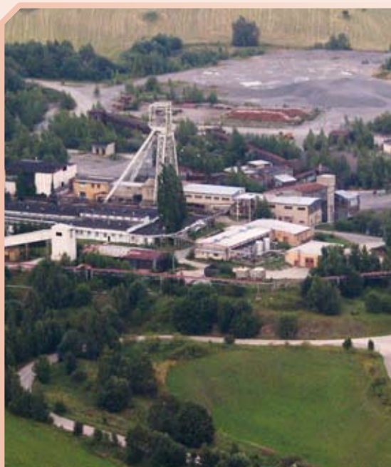
Důl Rožná blízko Žďáru nad Sázavou je posledním hlubinným uranovým dolem ve střední Evropě. Uran se zde těží od roku 1957.

V souvislosti s pokračující těžbou ložiska Rožná se pozornost upírá na ložiska Brzkov a Věžnice, kde v letech 1976–1990 probíhalo vyhledávání uranových rud. Během tohoto období bylo v okolí obcí Polná, Jamné a Brzkov na rozsáhlé části strážeckého oblouku o ploše cca 220 km 2 odvrtno celkem 1641 mapovacích vrtů, vyhloubeno 584 kopaných sond a vykopáno 560 rýh o celkové délce 59 204 m. Perspektivní místa byla ověřena 223 hloubkovými vrty. Lokality Brzkov a Věžnice se nacházejí nedaleko těžebně – úpravarenského komplexu Dolní Rožínka. Těžitelné zásoby uranu