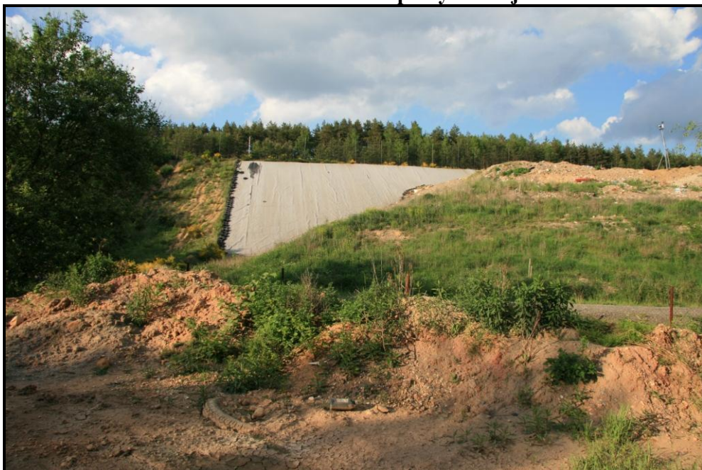
Obr. č. 6: Pískovna u Chotíkova sloužící po vytěžení jako skládka ostatních odpadů.