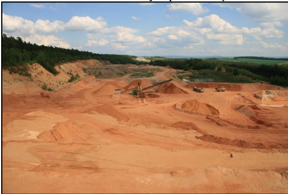
Obr. č. 5: Pískovna u Kůští zavážená již v průběhu těžby inertním materiálem.